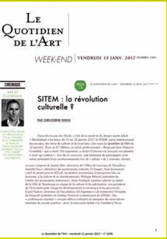
Le Quotidien de l'Art 13.01.2017 «SITEM : la révolution culturelle ?»

Mais l'évolution des musées eux-mêmes, reste notre point focal. Que deviennent-ils dans ces bouleversements qui s'annoncent ? Numérique. Marketing. Mécénat. Une partie grandissante de leur activité rejoint l'économie d'entreprise. La recherche de financements d'appoints est une activité de tous les instants. Objectifs et acteurs nouveaux apparaissent : la transversalité s'impose. Comprendre ces transformations et les exprimer, l'objectif ambitieux du SITEM 2018.