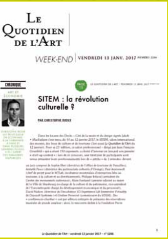
Le Quotidien de l'Art 13.01.2017 «SITEM : la révolution culturelle ?»

Mais l'évolution des musées eux-mêmes, reste notre point focal. Que deviennent-ils dans ces bouleversements qui s'annoncent ? Numérique. Marketing. Mécénat. Une partie grandissante de leur activité rejoint l'économie d'entreprise. La recherche de financements d'appoints est une activité de tous les instants. Objectifs et acteurs nouveaux apparaissent : la transversalité s'impose. Comprendre ces transformations et les exprimer, l'objectif ambitieux du SITEM 2018.